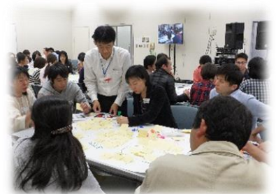
昨年の研修のようす